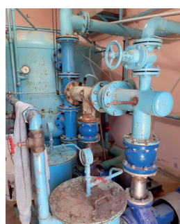
État de la machinerie de la piscine

En juin 2011, les précédents élus communautaires et de La Crèche, prenaient connaissance du diagnostic des installations de la piscine, réalisé par le bureau Bet Poureau, spécialiste dans l'ingénierie du bâtiment, et qui préconisait une remise en état des installations pour un montant de 1 929 000 € TTC. Les élus municipaux de l'époque, par l'intermédiaire de leurs représentants à la Communauté de Communes, connaissaient donc parfaitement ce dossier, les mises en garde de l'ARS et les devis de réparation de cette piscine. Les différents comptes-rendus des réunions des Maires en témoignent. Avril 2014, le dossier du