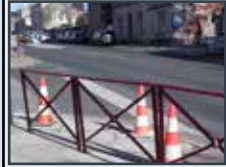
Aménagement du parking du Champ de foire